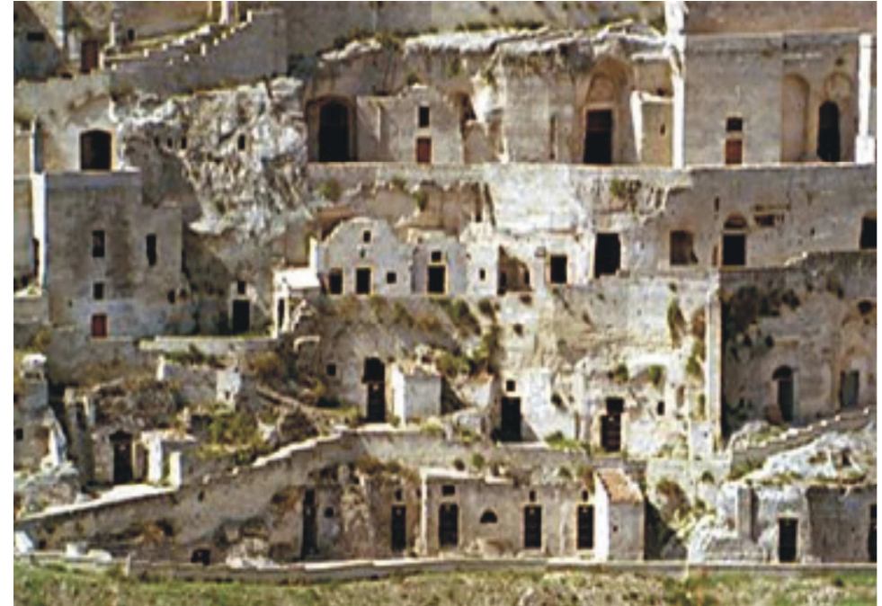
Case Sassi di Matera

“Gli occhi che vedono bagliori sono terminali irripetibili del mondo.